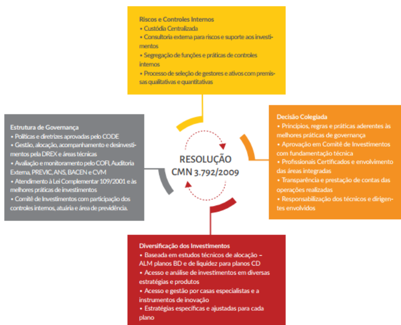
Diagrama 1 – Processo Decisório de Investimentos

Abaixo é apresentado fluxograma do Processo decisório de Investimento da Fundação.